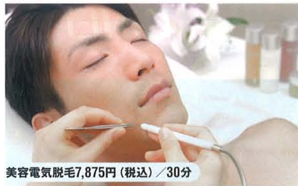
美容電気脱毛7,875円(税込)/30分